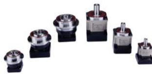
高精行星式减速机