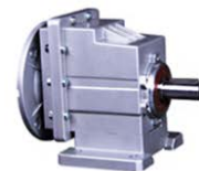
MRC系列斜齿轮减速机