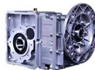
KM斜齿轮-准双曲面齿轮减速机