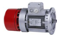
BM三相异步制动电动机